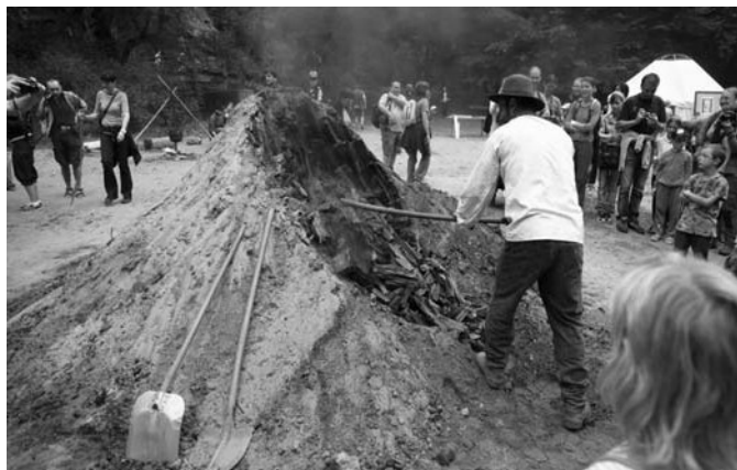
Rozebírání mlíře přilákalo přes sto návštěvníků. Uhlí získalo certifikát regionálního výrobku a lidé si mohli odnést domů užitečný „suvenýr“.