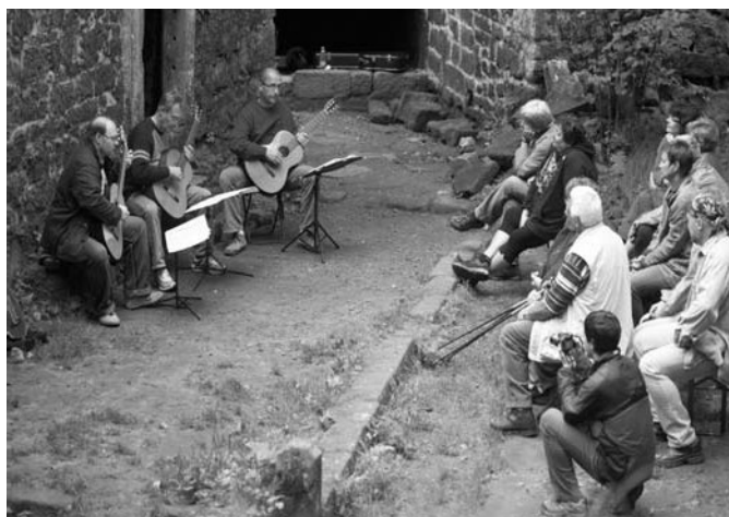
... a kytarový koncert skupiny Guitar Arte Trio, který začal symbolicky písní Rozvíjej se poupátko, zahranou na loutnu.