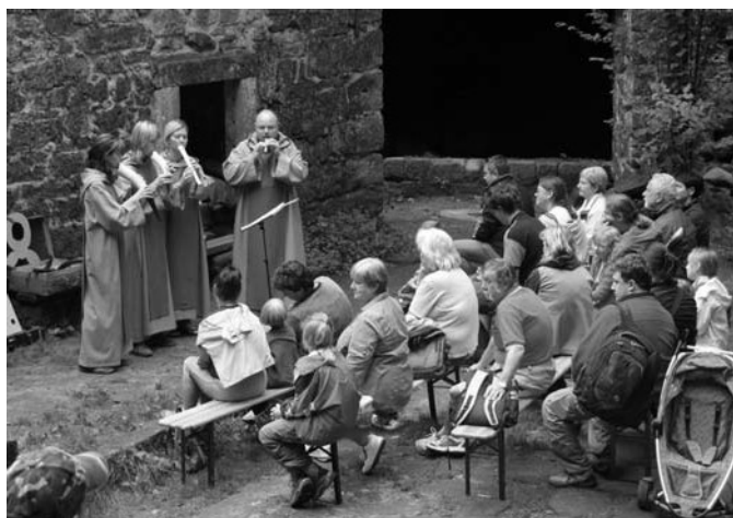
Týdenní akci zpříjemnil koncert skupiny SoliDeo u Dolského mlýna....